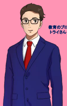
教育のプロ トライさん